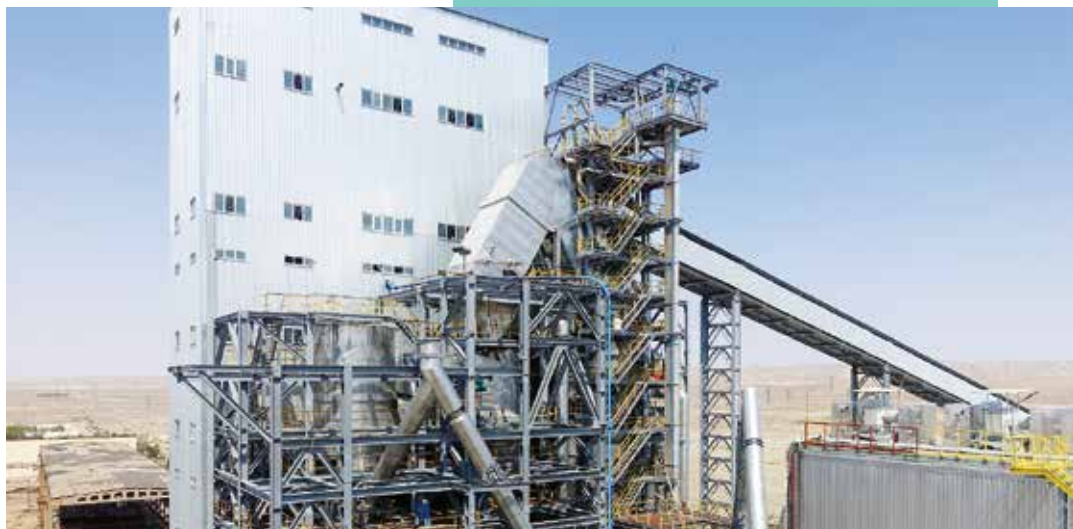
Печь с циркулирующим кипящим слоем