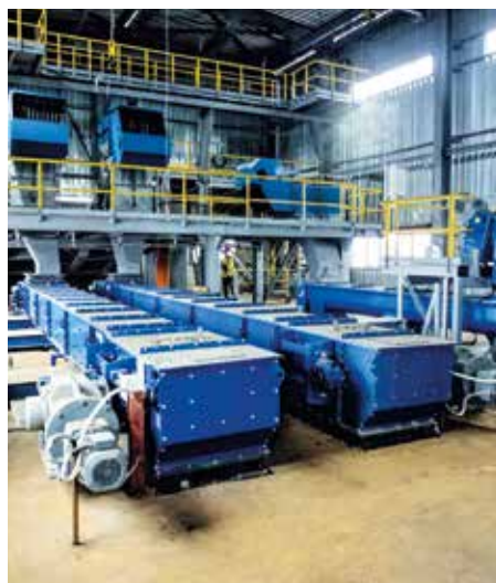
Оборудование подачи материала