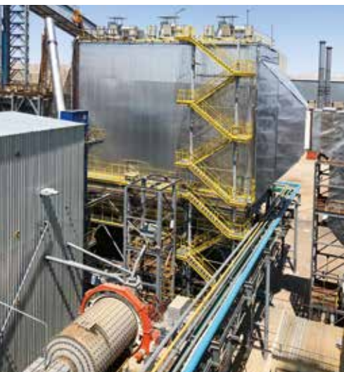
Электрофильтр, шаровая мельница